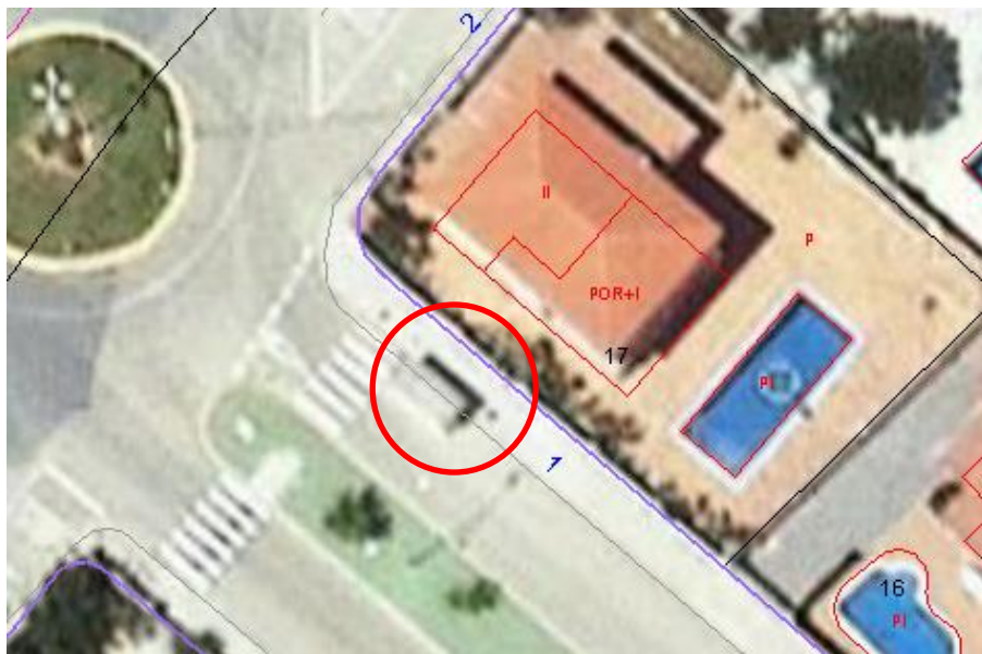
ZONA D'ACTUACIÓ PREVISTA